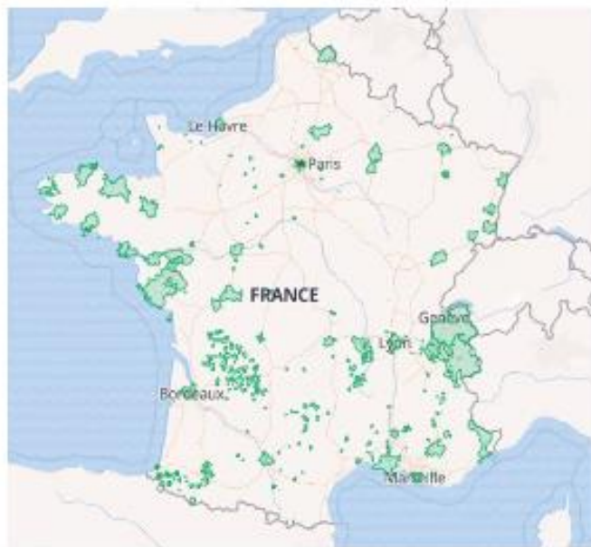
2 162 communes représentées / 3 869 076 adresses gérées par les collectivités Capture d'écran du site adresse.data.gouv.fr le 29/10/21