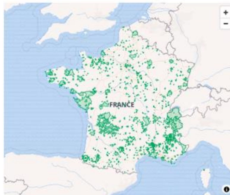
3 340 communes représentées / 4 895 481 adresses gérées par les collectivités Capture d'écran du site adresse.data.gouv.fr le 14/06/21